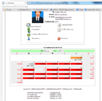
เรียบเรียง : ศักดา ปิ่นดวงค์

หลังจากที่มหาวิทยาลัยได้นำระบบสแกนลายนิ้วมือเพื่อบริการลงทะเบียนบุคลากรมหาวิทยาลัยแม่โจ้-แพร่ เฉลิมพระเกียรติ งานเทคโนโลยีสารสนเทศได้พัฒนาโปรแกรมเพื่อดึงข้อมูลจากเครื่องสแกนลายนิ้วมือมาแสดงผลผ่านเว็บไซต์งานบุคคลเพื่ออำนวยความสะดวกในการตรวจเช็คการมาทำงานบุคลากรและช่วยให้เจ้าหน้าที่งานบุคคลสรุปผลการมาทำงานเพื่อรายงานไปยังกองการเจ้าหน้าที่เป็นประจำทุกเดือน ในบางครั้งอาจจะเกิดความผิดพลาดในการสแกนนิ้วไม่ผ่านหรืออาจจะลืมสแกนในบางวัน ดังนั้นจำเป็นที่บุคลากรทุกท่านต้องตรวจเช็คข้อมูลของตนเองเพื่อความถูกต้องก่อนการรายงานผลไปยังกองการเจ้าหน้าที่ โดยบุคลากรสามารถตรวจเช็คข้อมูลได้ที่เว็บไซต์งานบุคคล http://www.phrae.mju.ac.th/department/humanresource/index.asp เมื่อล็อกอินเข้าสู่ระบบแล้วในเว็บไซต์จะแสดงข้อมูลการมาทำงานเป็นรายเดือนท่านสามารถเลือกเดือนที่ต้องการดูโดยคลิกที่ Listbox